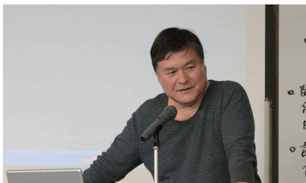
昨年6月28日の第2回絵コンテ講座より